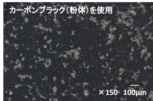
カーボンブラック濃度20wt%のコンパウンドペレットによる成形品表面